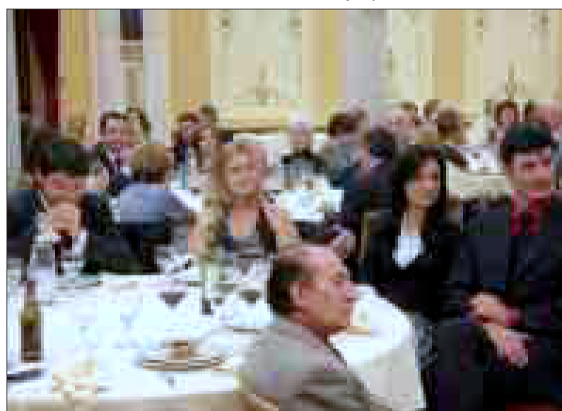
Los artistas también participaron en la cena.