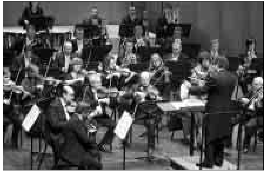
Concierto de Año Nuevo de la Orquesta Filarmónica de la Ópera de Lassy, dirigida por Carlos Saura.