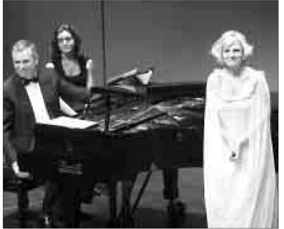
La soprano Ainhoa Arteta, con Malcom Martineau al piano.