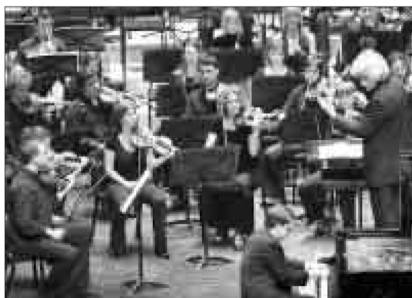
La Orquesta Sinfónica de la Academia del Gran Teatro del Liceo de Barcelona.