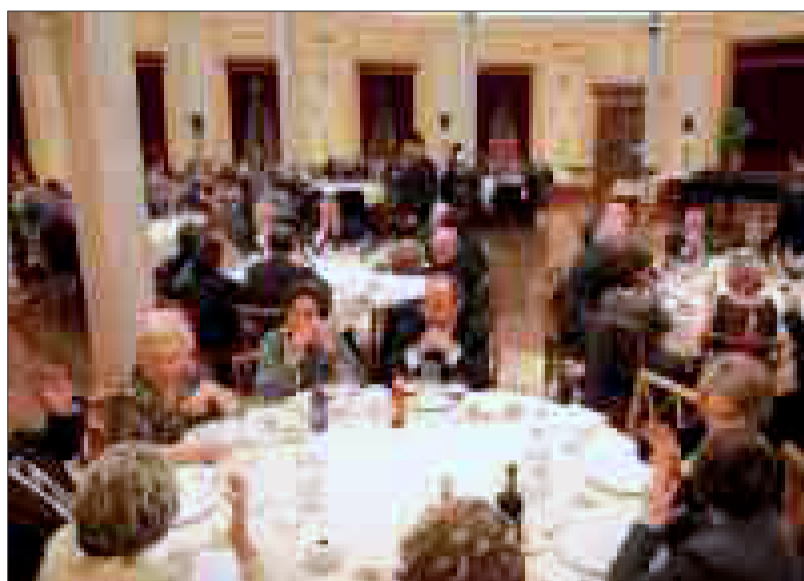
Un gran número de socios y colaboradores se reunió en el Círculo Industrial.