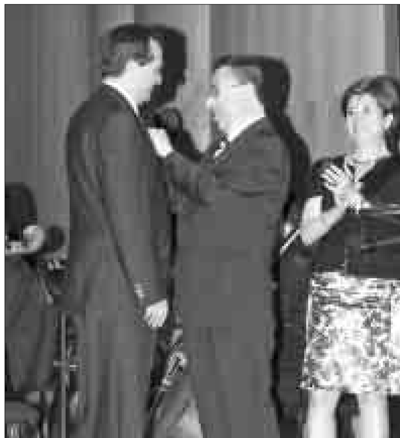
Adolfo Seguí (2008)