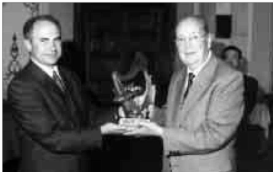
Círculo Industrial (2005)