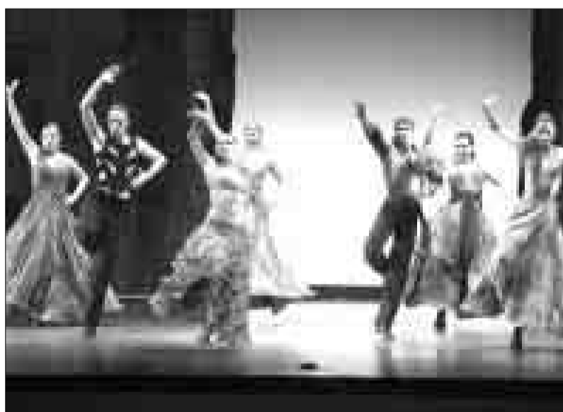
El Ballet Español de Murcia interpretó el ballet flamenco 'Penélope'.