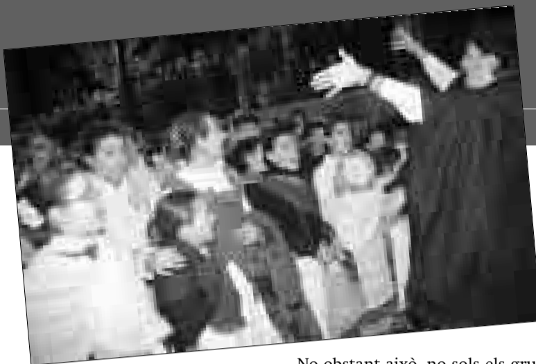
El grupo que canta en el Bando Real, representando al pueblo

Vicepresident i Cofundador de l'Associació d'Amics de la Música d'Alcoi.