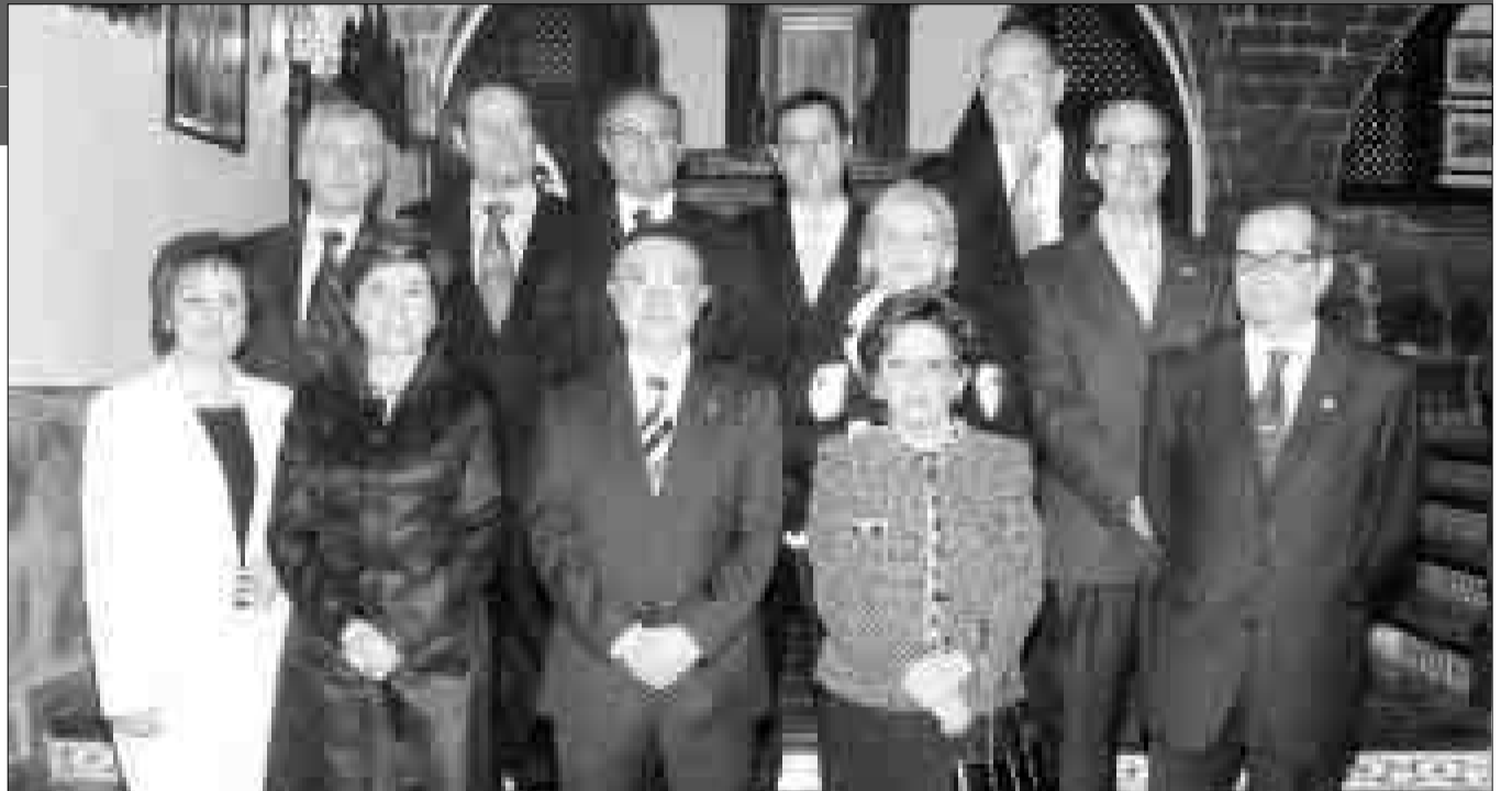
Miembros de la actual junta directiva de la Asociación de Amigos de la Música de Alcoy.

La Asociación, durante este cuarto de siglo ha vivido varias etapas totalmente diferenciadas. Los primeros cinco años fueron muy difíciles pese a los trascendentales apoyos del Ayuntamiento de Alcoy, de la entonces Caja de Ahorros de Alicante y Murcia, hoy Caja Mediterráneo, de la Diputación Provincial de Alicante, de la Consellería de Cultura de la Generalitat Valenciana y de medios de comunicación como el Diario Ciudad y Radio Alcoy, emisora que, además, durante diez años, mantuvo un programa radiofónico dedicado a la Música Culta presentado y producido por nuestra Asociación. En esos siete años se consiguió superar la cifra de 60 actividades organizadas, pero no se lograba traspasar la cifra de los trescientos asociados, con déficits