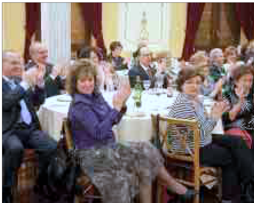
Exdirectivos aplauden el recital.

La culminación de la temporada de aniversario de la Asociación de Amigos de la Música fue la celebración, el pasado sábado, de una cena conmemorativa que se convirtió en un reconocimiento a las personas que durante veinticinco años han contribuido tan decisivamente a transformar un panorama cultural alcoyano que se había quedado estrecho para las aspiraciones del público local. La creación de la entidad fue la