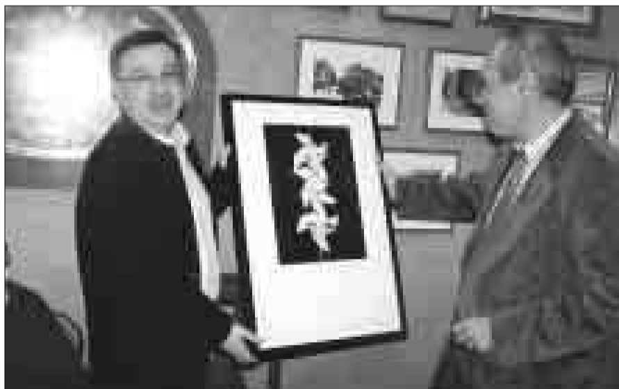
Diario Ciudad de Alcoy (2004)