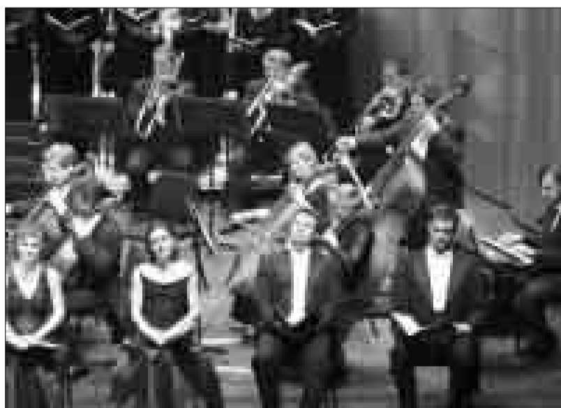
Solistas, coro y orquesta de Ceske Budejovice interpretaron el 'Réquiem' de Mozart.