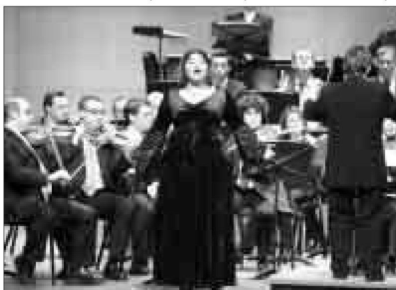
Gala de Zarzuela con la Orquesta Sinfónica Mare Nostrum.