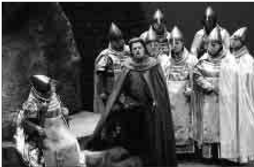
Una escena de 'Il Trovatore', de Verdi, por el Coro y Orquesta Filarmónica de Pleven.