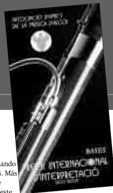
Portada de las bases del Premio de Interpretación

El intérprete es el auténtico "médium" entre la literatura musical y el público. De él depende que el inagotable patrimonio musical sea transmitido al público con el rigor necesario. Para ello muchos jóvenes intérpretes, concluida su formación académica, necesitan plantearse retos y estímulos que contribuyan a su maduración interpretativa y a conocerse a sí mismos, a la vez que tomar la experiencia del contacto con el público. La Asociación de Amigos de la Música de Alcoy puede estar orgullosa de su contribución a esta labor. Son ya nueve ediciones de este premio, que cada vez ha tenido mayor eco internacional, y los melómanos debiéramos felicitarlos por ello. Sin embargo, lo que toca ahora es felicitar a todos los amigos de esta asociación por estar en la brecha estos 25 años y desear que sigan haciéndolo desde el placer que supone trabajar por la música. ❖