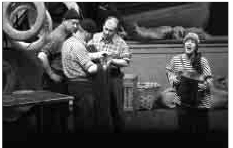
'La tabernera del puerto' por la Sinfónica de Castellón y el Coro Sasibill, dirige José Rafael Pascual.