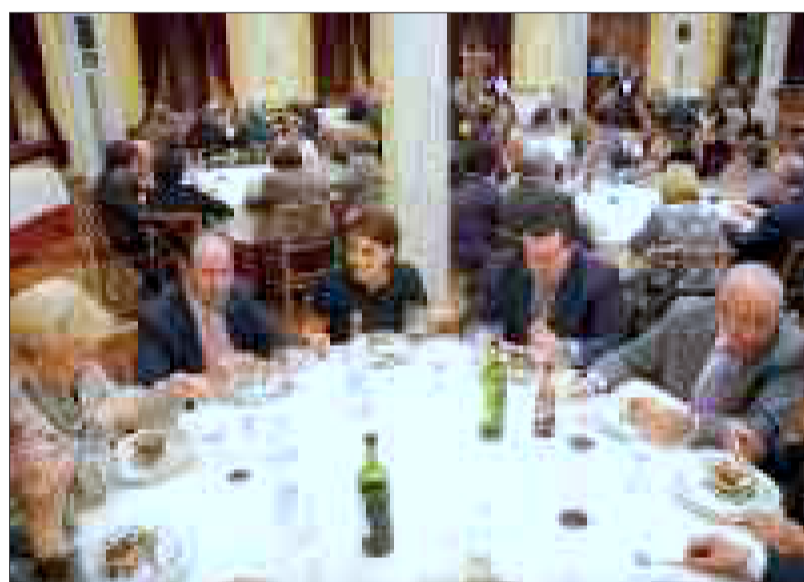
Socios de la AAMA, durante la velada.