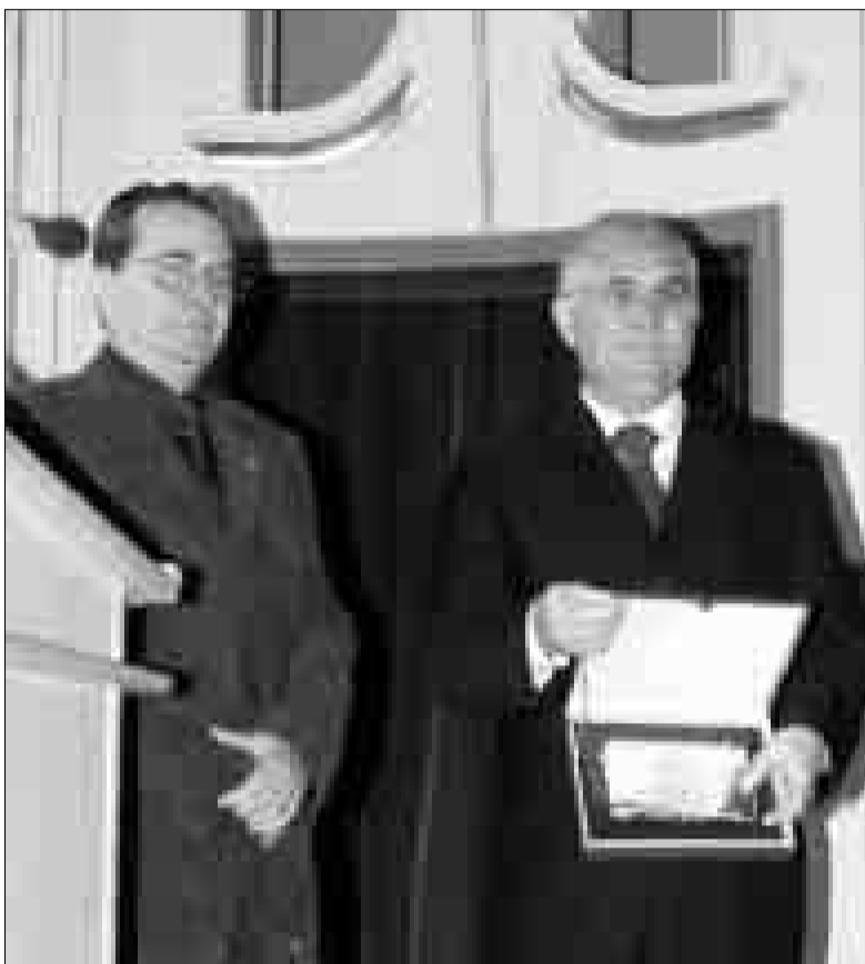
Radio Alcoy (2007)