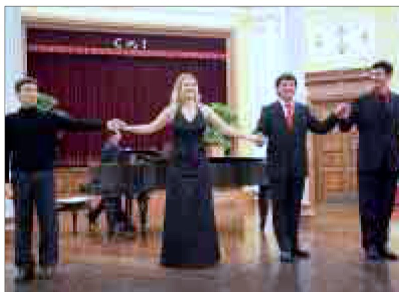
Los cantantes y el pianista saludan tras su recital.